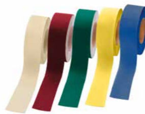
Systemzubehör: Stamcoll Tape

Technisch bedingt können die gedruckten Farben von den realen Farbtönen der Stamisol Advanced FA POP Kollektion abweichen (Originalmuster auf Anfrage verfügbar) und haben rein informativen Charakter.